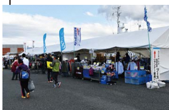
ゴール会場 地元物産展、スポーツ用品グッズ販売 ブースなどがあります。