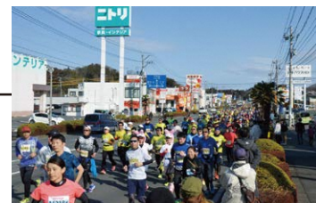
鹿島街道 レース序盤の緩やかな下り坂。 飛ばしすぎ注意!