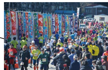
江名港 いわきサンシャインマラソンといえば! 江名港の大漁旗!