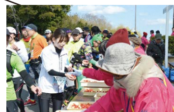
マリントワー下 地元の食材を振る舞う「特産物エイド」!