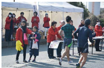
日産いわき工場付近 レース後半、皆さんの背中を後押しします!