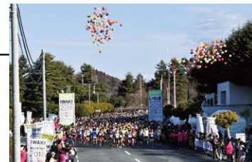
いわき陸上競技場 マラソンスタート会場